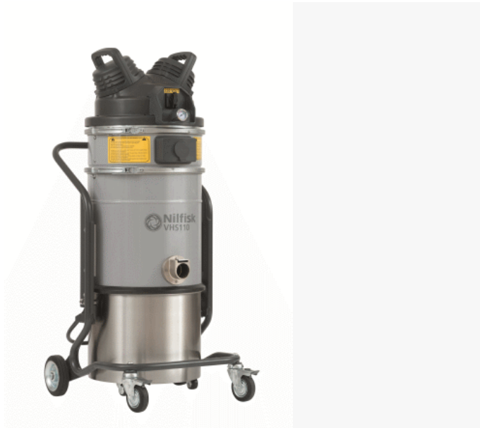
A kép illusztrációként szolgál.